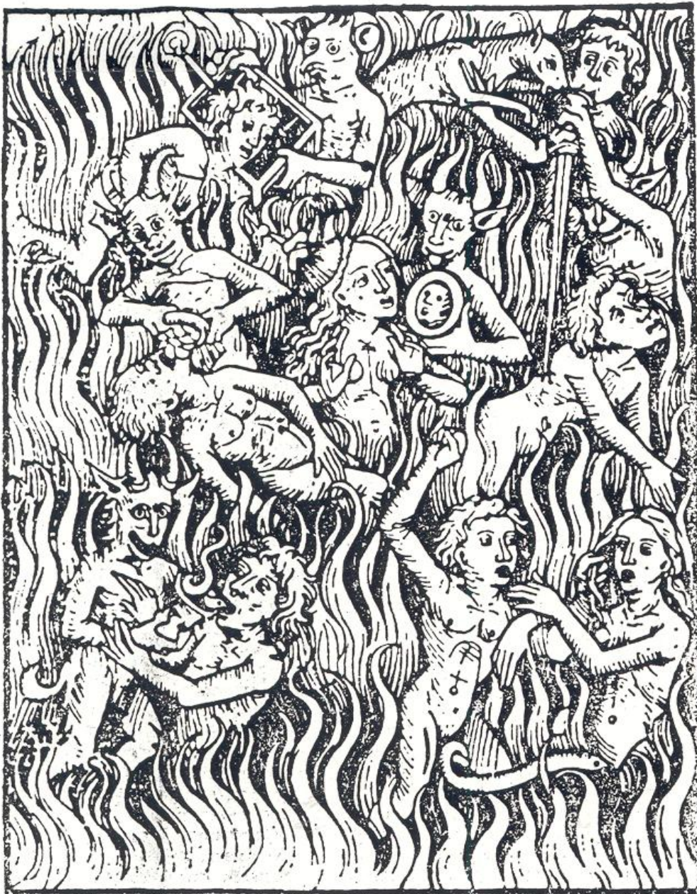
De hel. Duitse houtsneede, 1486.

p.s.: artikel gescand december 2004, mogelijk nog wat scan-foutjes erin; verder is de oude spelling van 1974 aangepast via spellingcontrole